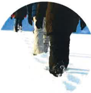
DÉCOUVRIR UN SENTIER PÉDESTRE