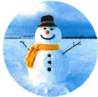
FAIRE UN BONHOMME DE NEIGE