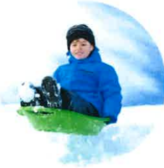
S'AMUSER EN GLISSANT