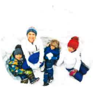
S'INSCRIRE AU DEFICHATEAUDENEIGE.CA