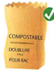
SACS EN PAPIER

Tous les sacs en plastique, qu'ils soient « compostables », « oxobiodégradables », « dégradables » ou conventionnels sont refusés dans le bac brun. Pourquoi? Parce que les sacs « compostables », « oxobiodégradables », « dégradables » se décomposent beaucoup plus lentement que les matières organiques laissant des morceaux de plastique dans le compost. Certains lambeaux de plastique peuvent également être emportés par le vent créant ainsi des nuisances dans le milieu naturel. De plus, les sacs de plastique fermés qui contiennent des matières organiques peuvent générer de fortes odeurs nuisant au voisinage du lieu de compostage. Pour toutes ces raisons, le ministère de l'Environnement a décrété que la Ville de Rimouski n'était pas autorisée à recevoir des matières organiques dans des sacs de plastique sur sa plateforme de compostage.