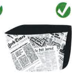
SACS EN PAPIER JOURNAL (faits maison)